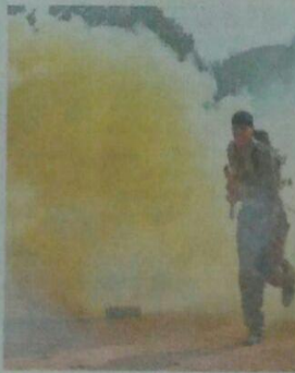
यहां युद्ध का प्रदर्शन हुआ तो कैडेटों के बीच जीत के लिए लड़ाई चला. तेवरक श्रेष्ठ के पीछे कला बॉटिंग जैसा दिखाई दिया।

राजनांदगांव. स्टेट स्कूल में रविवार को एनसीसी डे का आयोजन किया गया। कैडेटों ने जहां युद्ध का प्रदर्शन किया वहीं स्पून रेस, कराते और पारंपरिक नृत्य के माध्यम से दर्शकों को लुभाया।