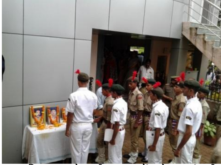
शास. दिग्विजय महाविद्यालय के शहीद जवानों को श्रद्धांजली देते हुए कैडेट गणतंत्र दिवस समारोह महंत राजा दिग्विजय दास स्टेडियम में