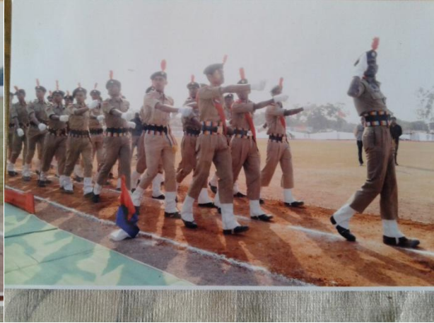
एन.सी.सी. परेड में सलामी देते हुए कैडेट