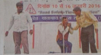
राजनांदगांव। मंचन के माध्यम से यातायात नियमों का महत्व बताते कलाकार।