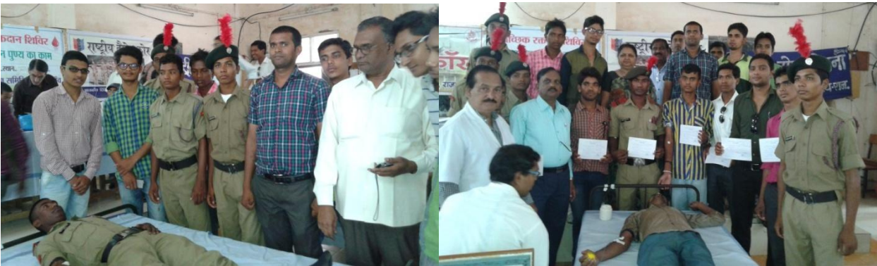
रक्त-दान करते हुए कैडेटस्