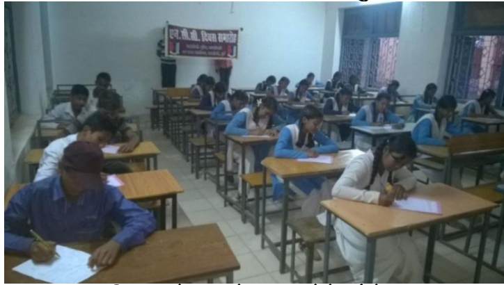
निबंध लेखन में भाग लेते कैडेट