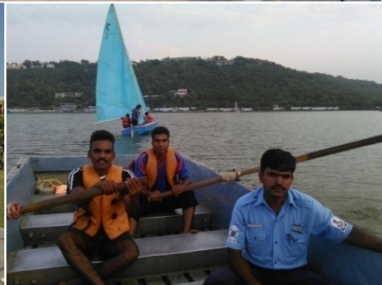
राष्ट्रीय नेवल शिविर विषाखापटनम् में महाविद्यालय के नवकाल कैडेट