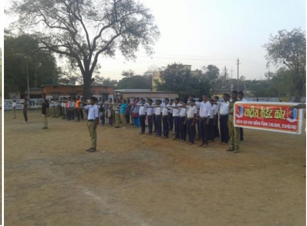
संविधान दिवस के अवसर पर एन सी सी अधिकारी, कैडेट क्लब के सदस्य एवं कैडेट 'पथ लेते हुए