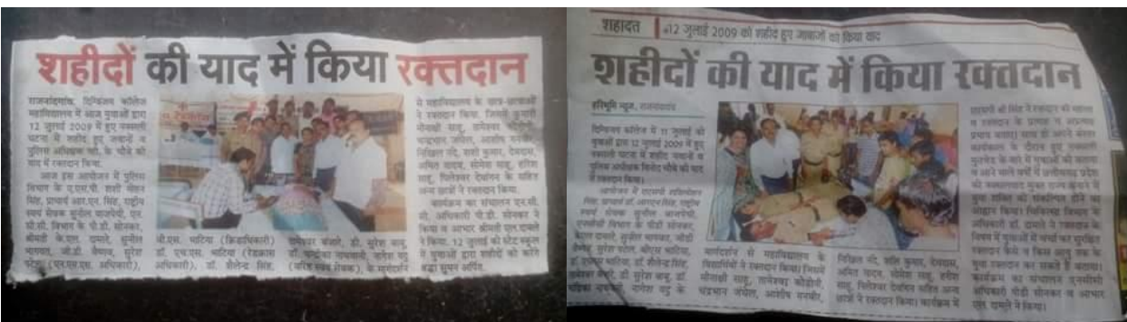
कैडेटस को प्रमाण पत्र भी वितरित किया गया