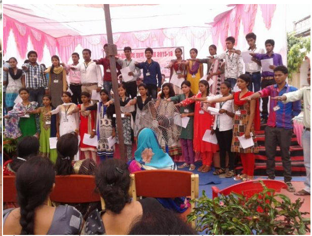
वार्षिक भापथ ग्रहण समारोह में पायलेटिंग करते एवं शपथ लेते कैडेट