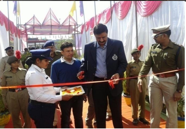
यातायात् सड़क सुरक्षा सप्ताह: कैंडेट रैली एवं समापन