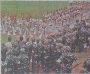
एनसीसी व पुलिस जवान के मार्च पास्ट की सराहना

अजानों का असाह। सोशियल के एक कोने में खड़े आईटीबीपी के जवानों ने जर्नल पास्ट कर रहे पुलिस जवानों और एनसीसी केडेट्स को दोस्ती दिखा। छात्र-छात्राओं की प्रस्तुति के बारे में कैच की। कुछ पल के लिए उनका उत्साह दर्शकों के लिए आकर्षण का केंद्र बना।