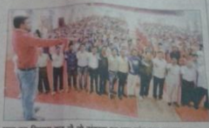
अतिरिक्तिय में अतिरिक्तिय परिसर में स्वच्छता की रूपरेखा तैयार की गई।