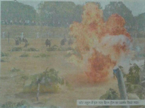
स्टेट स्कूल में इस तरह बैल शूट का प्रदर्शन किया गया।

राजनांदगांव. स्टेट स्कूल में रविवार को एनसीसी डे का आयोजन किया गया। कैडेटों ने जहां युद्ध का प्रदर्शन किया वहीं स्पून रेस, कराते और पारंपरिक नृत्य के माध्यम से दर्शकों को लुभाया।