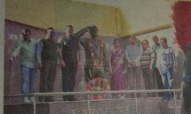
राजनांदगांव। नेताजी सुभाषचंद्र बोस की जयंती में शामिल हुए अतिथि।