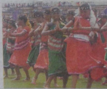
छात्राओं ने आदिवासी नृत्य कर दर्शकों का मन मोहा

छुरी में झुमे छात्र-छात्राओं के अतिथि की रूप में यहां के दो दर्शक दर्शक का मन मोहा किया। वे थिरकते रहे और दर्शकों का कतल हास पर ताल देना रहा। इसी तरह अन्य स्कूलों की प्रस्तुति भी रही।