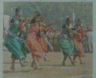
सामूहिक नृत्य ने मन मोह लिया