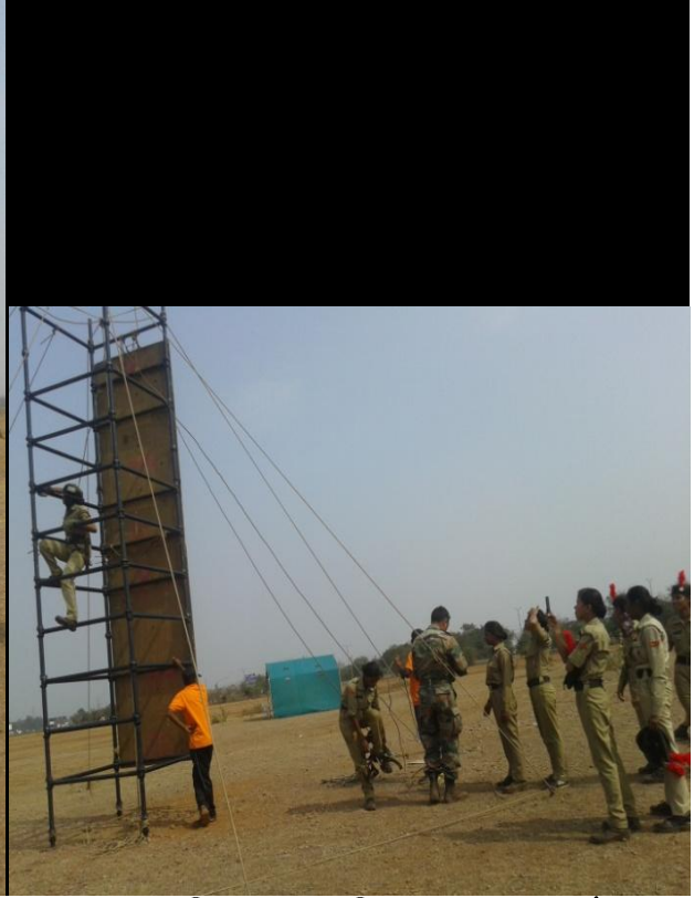
एडवेंचर प्रशिक्षण के तहत कैडेट स्लदविंग एवं वाल-क्लाइम्बिंग का प्रशिक्षण प्राप्त करते हुए