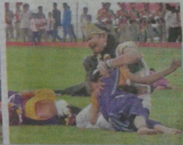
आतंकवाद पर भारत मां के रुदन का जीवंत मंचन

मन अंदाज से प्रियतम बाद। गणतंत्रिय की हल प्रस्तुति ने दर्शकों की अंदाज गज कर दी। आतंकवाद के शिकार लोगों पर अजान जं गरी दुःखन देना हर किस्म के हकीमी को काह किशर और उन्हें बर्दाश्त की। (संजीवन खबर • पृष्ठ 15 व 20 पर)