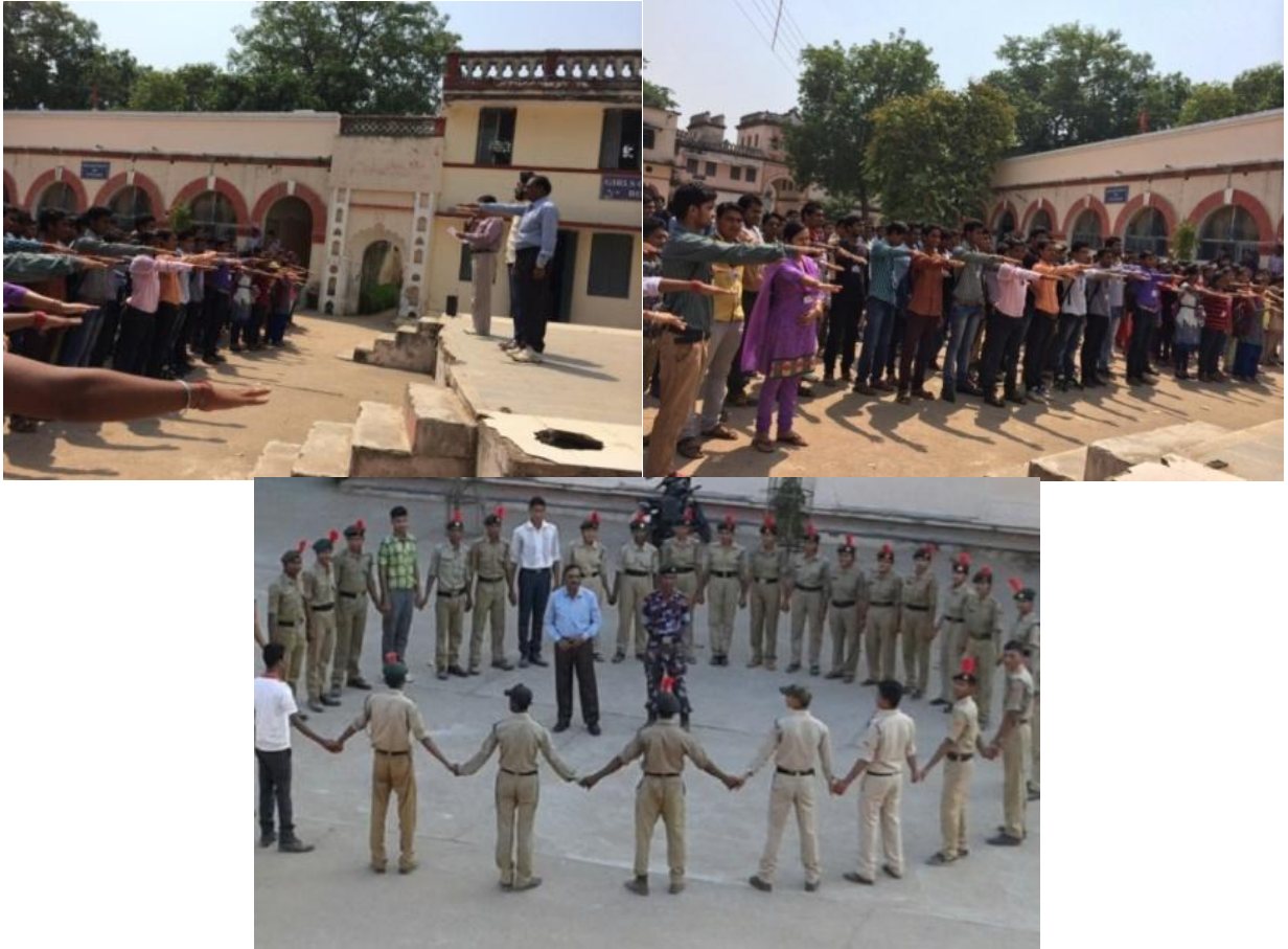
मतदाता दिवस के अवसर पर प्राचार्य द्वारा छात्र-छात्राओं को 'पथ दिलाते हुए